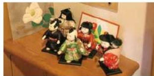
基礎生活レクリエーション