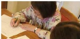
個別レクリエーション