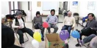
集団レクリエーション